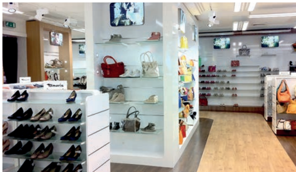
■ Aeschbach, 13 magasins répartis en Suisse romande

Depuis plus de 100 ans, l'enseigne est la référence dans la Cité de Calvin pour qui veut trouver chaussure à son pied, avec une garantie unique de style et de qualité. Entreprise familiale employant plus de 180 personnes, Aeschbach est aujourd'hui l'un des leaders du marché romand de la chaussure et de l'équipement de sport, avec 13 magasins répartis dans toute la région.